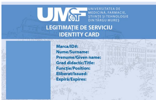
Legitimatie cadre didactice – fata