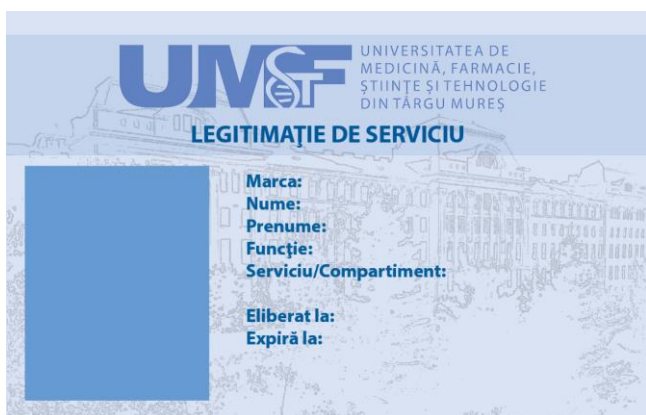
Legitimatie auxiliar/nedidactic – fata